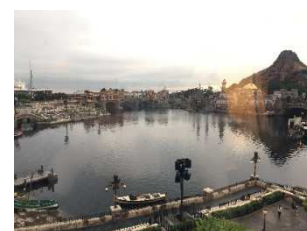
ホテルからの風景